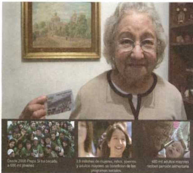
Desde 2008 Prepa se ha dedicado a 690 mil jóvenes.

ESTA TABLA SÓLO APLICA PARA VEHÍCULOS PARTICULARES. EN CASO DE CARGA O SERVICIOS PÚBLICOS CONSULTAR ART. 161 BIS12 Y EN CASO DE MOTOCICLETAS ART 161 BIS15 DEL C.F.D.F.