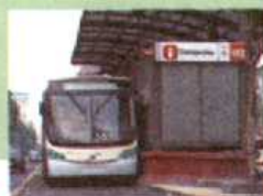
Metrobús Línea 3