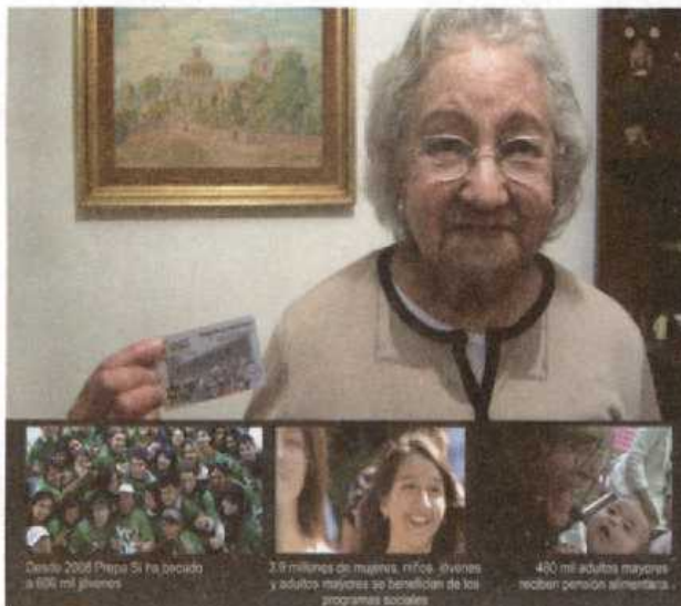
Desde 2006 Prepa Si Pa decidió a 800 mil alumnos

ESTA TABLA SÓLO APLICA PARA VEHÍCULOS PARTICULARES, EN CASO DE CARGA O SERVICIOS PÚBLICOS CONSULTAR ART. 161 BIS/2 Y EN CASO DE MOTOCICLETAS ART 161 BIS/5 DEL C.F.D.F.